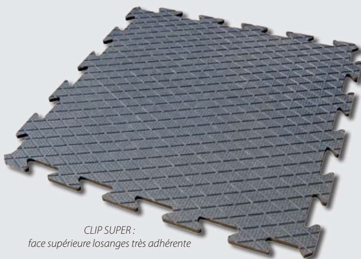
CLIP SUPER : face supérieure losanges très adhérente